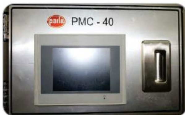
PMC 40 - Soft Touch HMI