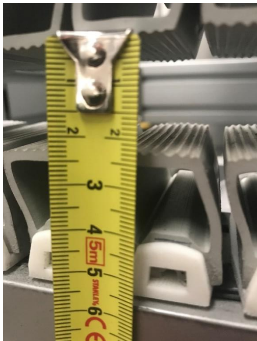
Exemple : 25 mm