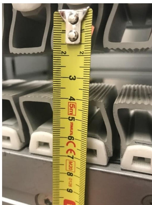
Possible maxi sur l'exemple : 45 mm